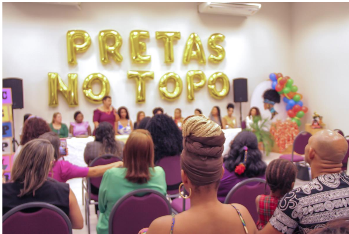
II Encontro Estadual das Mulheres Pretas Latino-Americanas e Caribenhas